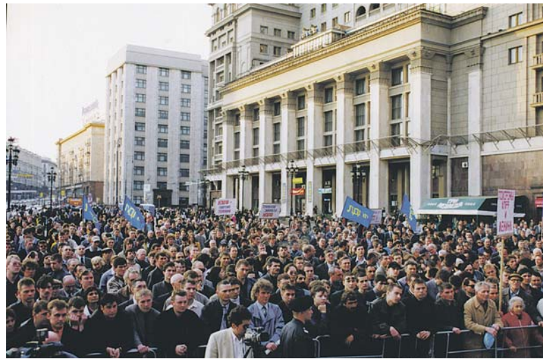
ЛДПР против повышения пенсионного возраста и введения норм потребления

Кроме того, на наш взгляд, у населения должно быть право выбора своей пенсионной стратегии. Рассмотрим опыт Европы, ничего выдумывать не надо.